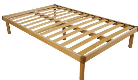
Venere Singola - 120