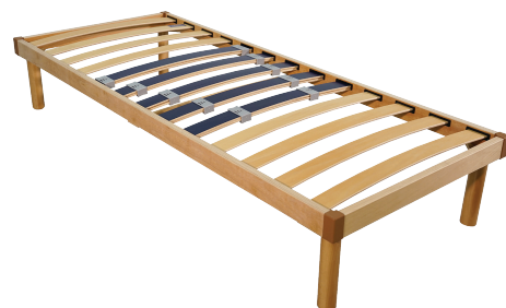
Venere Singola Lusso