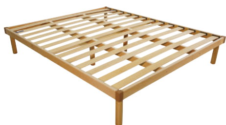
Venere Matrimoniale Doga Unica