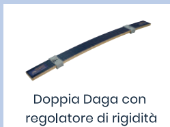
Doppia Daga con regolatore di rigidità